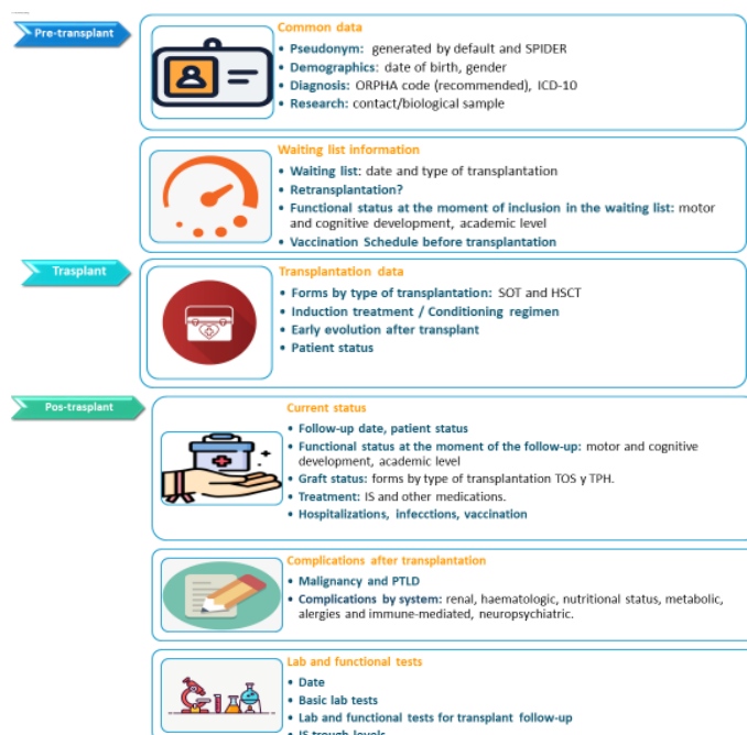
Figura 2: Datos requeridos durante todas las fases del trasplante

Seguendo los objetivos del registro PETER, se recopilarán datos prospectivos sobre las características del paciente, los datos de trasplante y los resultados. Los datos posteriores al trasplante se registrarán 3 meses después del trasplante y anualmente, hasta que se complete la transición a la atención médica de adultos (fig.2).