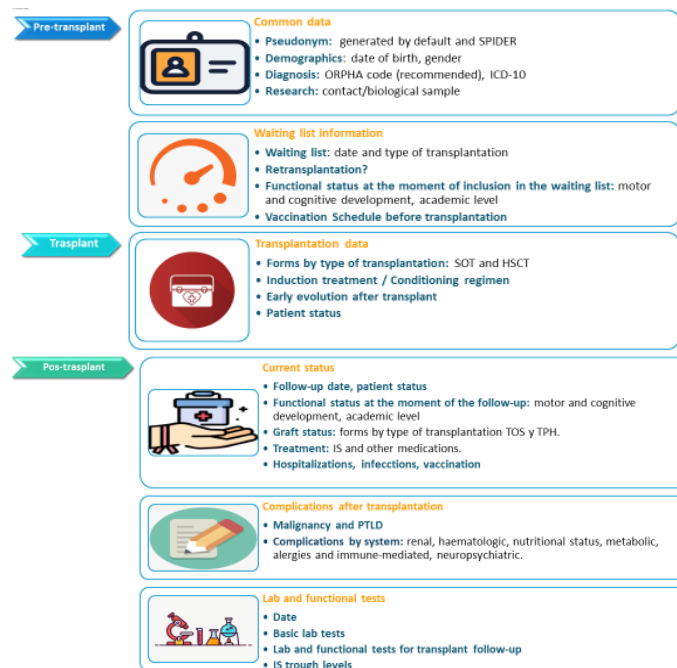
Illustrazzjoni 2: Dejta Mehtieġa Matul il-Fażijiet Kollha tat-Trapjant

rreġistrata 3 xhur wara t-trapjant u kull sena, sakemm titlesta t-tranzizzjoni għall-kura medika tal-adulti (fig.2).